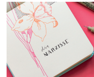
Narzissen malen Seite 14