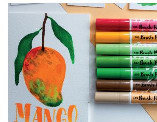
Sommerliche Postkarten Seite 20