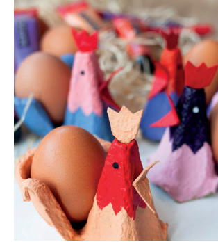
Lustige Hühner - Eierbecher Seite 6