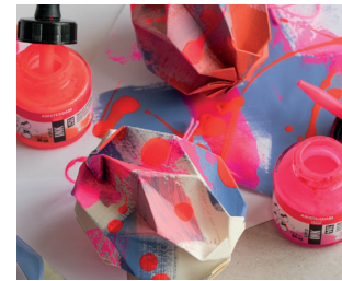
Papier- Ostereier Seite 12