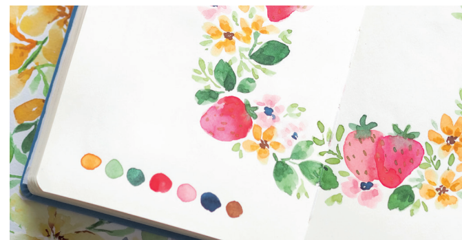
@heavyweightpaper Mareike Urban im Interview Seite 28