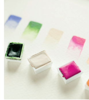
Frühlings - Farbpalette Seite 4