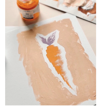
8 Arten Möhren zu malen Seite 8