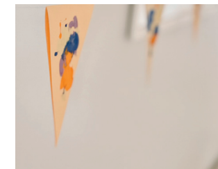
DIY Wispelkette Seite 18