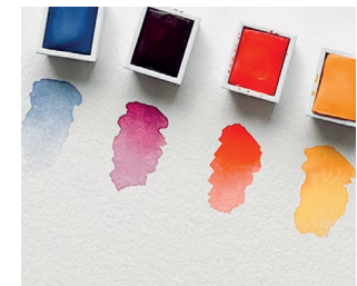
Sommer- Farbpalette Seite 18