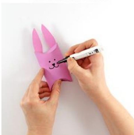
Gesicht & Details aufmalen