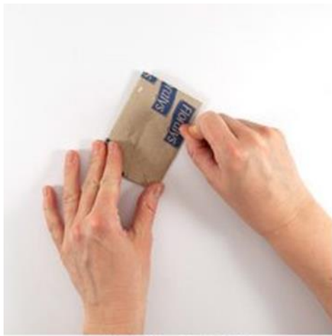
Rolle platt drücken